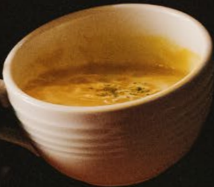
パンプキンの クリームポタージュ 560 乳

国産ポークと香味野菜を煮込んだソースと ゴルゴンゾーラの濃厚なクリームソースです