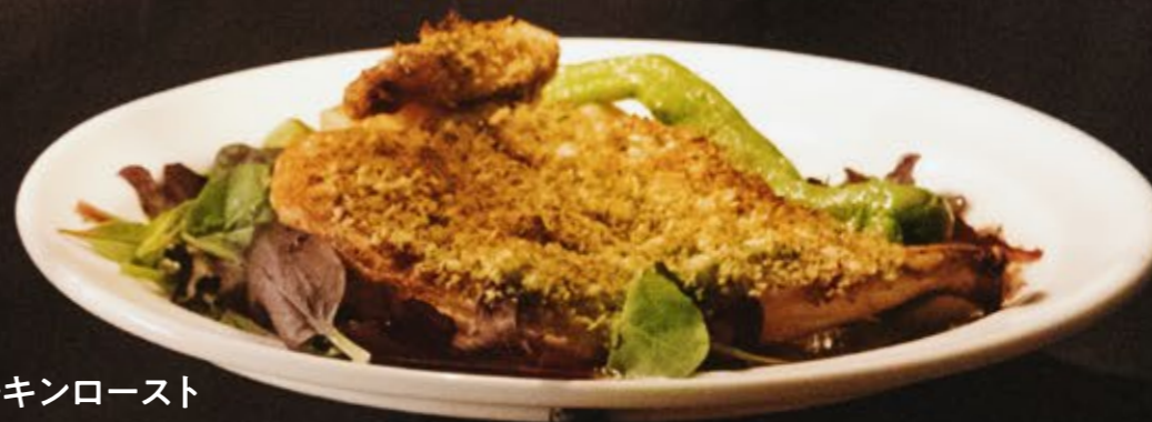
小悪魔チキンロースト 1,680 小麦