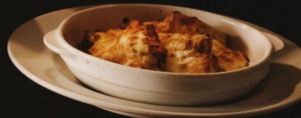
スイートポテトのチーズグラタン 980 乳 小麦

9/13(金)-10/31(木) 今年もROCKにハロウィンがやってきた! おばけや小悪魔も虜になるボリューム満点の 限定メニューを召し上がれ!