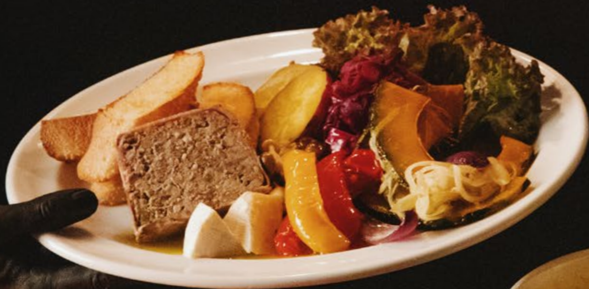
ハーベストプレート 1,490 乳