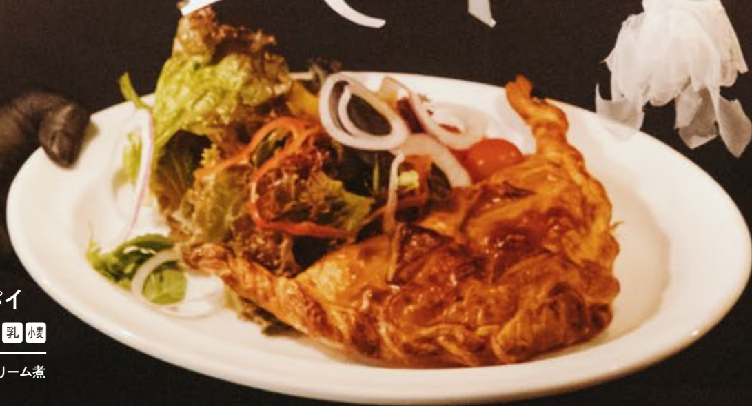
ハロウィンミートパイ 1,680 乳 小麦