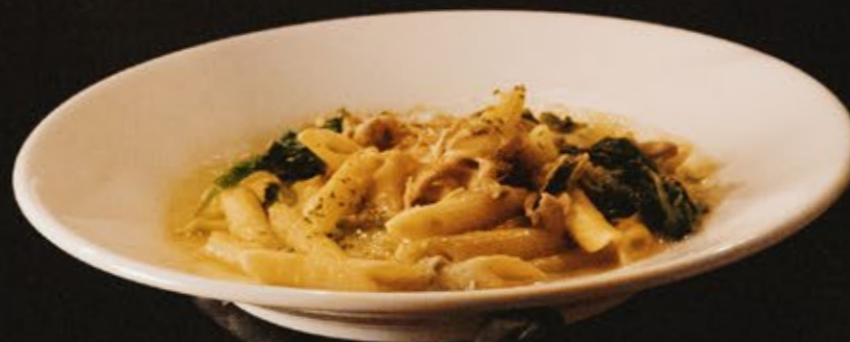
ポークの煮込みと ゴルゴンゾーラチーズの クリームペネ 1,280 乳 小麦

国産ポークと香味野菜を煮込んだソースと ゴルゴンゾーラの濃厚なクリームソースです